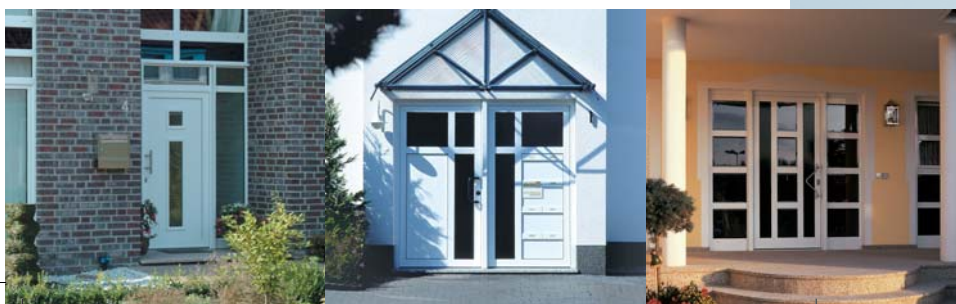
EuroFutur ® Classic Haustürsystem mit 70 mm Bautiefe.

68519 Viernheim Georg-Herbert-Str. 5 Tel: 06204 - 79254 - Fax: 06204 - 6864